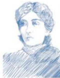
STEFANIA SEMPOŁOWSKA 1867-1944

Do moralnych założeń, które wejść powinny do programu przyszłej szkoły, zaliczamy także wychowanie międzynarodowe. Nie pozostaje ono w żadnej sprzeczności z wychowaniem narodowym, stanowi raczej niezbędne jego dopełnienie.