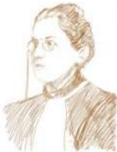
JÓZEFA JOTEYKO 1866-1928

(...) najlepsza nawet szkoła może być jedynie wstępem do dołszej pracy, a samokształcenie jest w zawodzie nauczycielskim jeszcze ważniejsze niż w każdym innym.